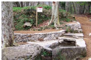
15-Font Molí Nou