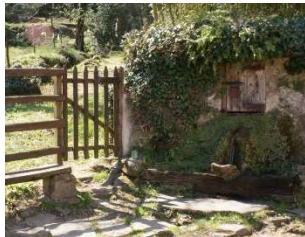
14-Font i Mas de la Fàbrega

La pluviositat és important (amb 1.082 litres per m 2 de mitjana entre 1987 i 1997) i per tant determina la gran abundància de fonts, recs, rierols i vegetació que podem trobar a Sant Feliu. A la falda de la Salut i a l'altiplà de Collsacabra, hi conviuen boscos de roures, castanyers, faigs, bedolls, prats i falgueres. Aquesta configuració del terreny afavoreix l'aparició de nombroses fonts i rierols amb abundància d'aigua tot l'any. A ponent i al nord, el paisatge és més sec, amb predomini del bosc de solell, amb alzinars, rouredes i un abundant sotabosc, més típic del Mediterrani. La hidrografia no és tan abundant com al vessant oposat, amb la riera de Sant Iscle i el torrent dels Bastons, i les fonts, en època de sequera, no són tant permanents com les del vessant de La Salut.