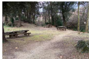
19-Font de la Fontana